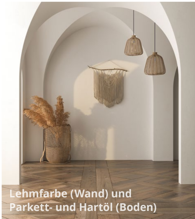
Lehmfarbe (Wand) und Parkett- und Hartöl (Boden)